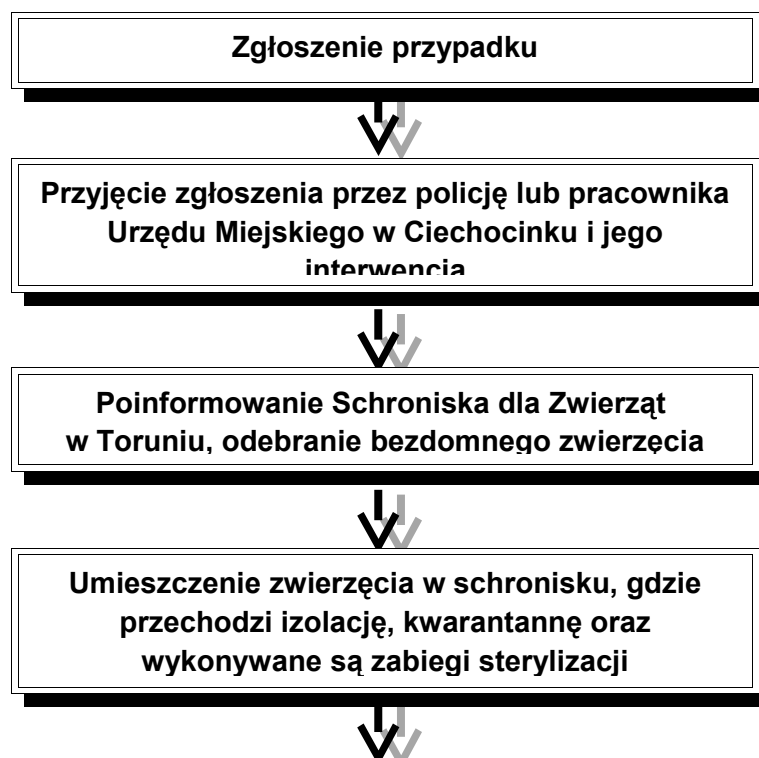
Rysunek 2. Schemat graficzny przypadku zwierzęcia pozostającego bez opieki (rannego, chorego)

Poniżej zaprezentowano schemat postępowania w przypadku zasygnalizowania przez mieszkańców miasta pojawienia się bezdomnego zwierzęcia.